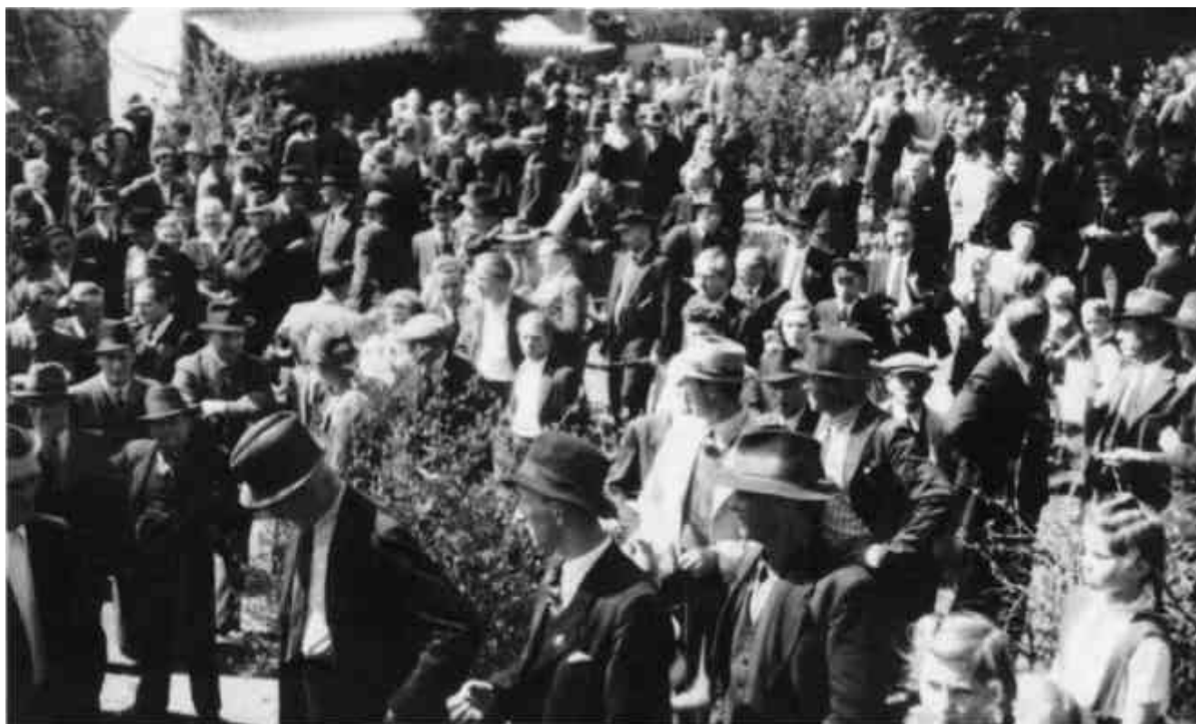
Abb. 6.1 1. Mai-Kundgebung in Marienberg

„...Schwieriger ist die derzeitige Wirtschaftslage. Unsere heimische Naturstein-Industrie hat den vorkriegszeitlichen Auftragshöchststand nicht wieder aufgeholt; die Kapazität ist bei weitem nicht ausgelastet infolge Auftragsrückgang bei Schotter für die Bundesbahn sowie entwicklungsbedingten Auftragsrückgang bei Basalt als Straßenbelag. Große Sorge bereitet zur Zeit die Wirtschaftslage der Grube Alexandria in Höhn (Braunkohle); für die Industriegewerkschaft Bergbau