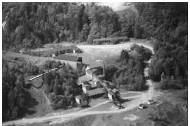
Abb. 2.6 Stöffel: Werkstatt (links oben), Mannschaftsraum (oben), Vor- und Nachanlage (Mitte), Verladung (Mitte links)