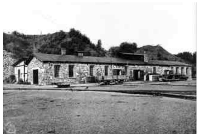
Abb. 2.10 Stöffel: Betriebswerkstätte