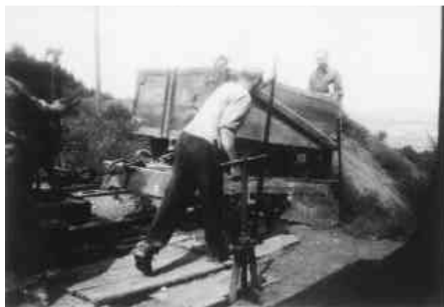
Abb. 2.15 Stöffel, am Bremsberg: Werner Henn

sowie Vertreter der Steinbruchhand- und Kleinbetriebe teil. Wegen des Autostraßenbaus (Autobahnen) wurden zusätzliche Aufträge für den Oberwesterwald erwartet. Bei Neueinstellungen sollten vor allen Dingen Wohlfahrts-Erwerbslose berücksichtigt werden, um eine Entlastung der Gemeinden herbeizuführen.