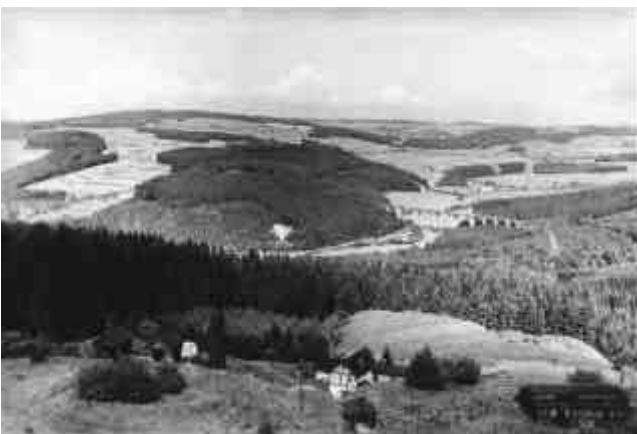
Abb. 2.5 Stöffel (vorne); im Hintergrund: Nistertalbrücke

Bis zum Ausbruch des ersten Weltkrieges dehnte sich die Basaltindustrie immer weiter aus. Brecher und Kipper wurden ständig gesucht. Während des Ersten Weltkrieges lag die Basaltindustrie fast völlig still. Nach dem Ersten Weltkrieg stieg die Produktion enorm an, was auf eine geänderte Nachfrage zurückzuführen war. Ab 1927/28 wird wieder ein Produktionsrückgang nachgewiesen, der sich bis 1933 fortsetzte. Für den Damm, der die Zuidersee von der Nordsee trennt und 1932 fertiggestellt wurde, ist viel Basaltmaterial verwendet worden. Dann im Zweiten Weltkrieg wurden der Basaltindustrie wieder viele Arbeitskräfte entzogen. Die weitere Techni-