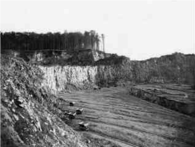
Abb. 2.3 Stöffel-Büdingen 1926

„Wetzstein“ zugestanden) und nach dem Ausscheiden von Karl Schäfer in 1938 in „Westerwaldbrüche Betrieb Rothenbacher Lay“ umbenannt. 1938 zählte der Steinbruch 101 Beschäftigte. 1941 im Krieg stillgelegt, erfolgte am 1.5.1950 erneute Betriebseröffnung. Die endgültige Stilllegung datiert vom 31.12.1965.