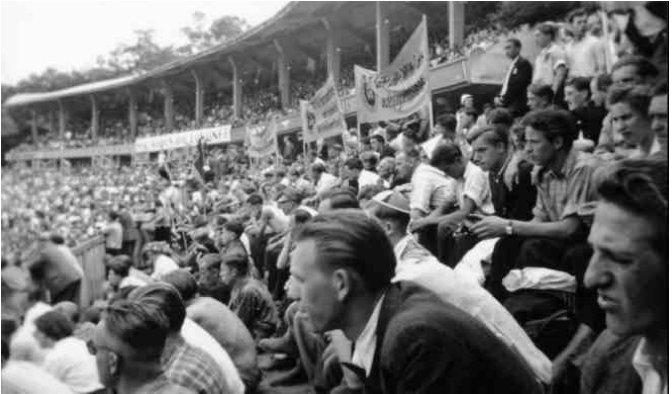
Abb. 6.4 1. DGB-Bundesjugendtreffen in Frankfurt (Main); vorne im Bild von rechts nach links: Karl Schüler u. Wilhelm Held

Zahlreich waren auch die Rechtsstreite vor Arbeits- und Sozialgerichten (Arbeiter- und Angestelltenversicherung, Unfall- und Knappschaftsversicherung sowie Versorgungs-Streit-sachen). Die meisten Klagen wurden geführt gegen die Bergbau-Berufsgenossenschaft (wegen Anerkennung der Steinstaublunge = Silikose als Berufskrankheit) und gegen die Steinbruchs-Berufsgenossenschaft, Sektion III, in Bonn (früher Köln-Ehrenfeld), ebenfalls wegen der durch die schwere Arbeit oft auftretenden Bandscheibenschäden. Die Hessische Knappschaft in Weilburg wurde laufend mit Eingaben auf Zahlung von Rentenvorschüssen angeschrieben, da die Rentenbescheide noch langwierig in Handarbeit erstellt wurden. Auch die Widerspruchsstelle des Arbeitsamtes Montabaur wurde reichlich mit Vorverfahren eingedeckt. So kann ich mich erinnern, daß in einem Winter für die Belegschaft des Steinbruches Meys & Co (Luckenbacher Lay) wegen Berechnung des Arbeitslosengeldes etwa 30 bis 40 Widersprüche an einem Tag eingelegt wurden.