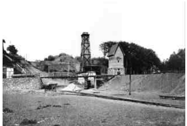
Abb. 2.8 Stöffel: Bremsberg, Kühlturm, Transformatorstation