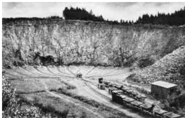
Abb. 2.17 Luckenbacher Lay