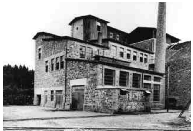
Abb. 2.9 Stöffel: Steinbrecheranlage