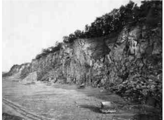
Abb. 2.4 Stöffel-Büdingen 1926

sierung und Mechanisierung setzte schon unmittelbar nach Kriegsende ein. Waren in den ersten Nachkriegsjahren noch viele Steinbrüche in Betrieb, wurden bis auf wenige Ausnahmen inzwischen alle Basaltbrüche stillgelegt.