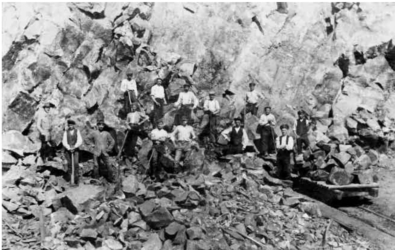
Abb. 2.1 Steinbrucharbeiter; an der Wand

Gegen Ende des Untermiozän wurde der Westerwald von einer tektonischen Unruhe erfaßt, die Gänge und Verwerfungsspalten verursachte. Erstmals seit dem Paläozoikum konnten sich vulkanische Schmelzen den Weg an die Erdoberfläche bahnen. Der Vulkanismus dauerte insgesamt gesehen also von etwa 40 Millionen Jahren an bis kurz vor Einsetzen der Eiszeit. Ein Schritt zurück: Bevor sich die ersten Lavamassen auf oder direkt unter der Erdoberfläche ergossen, stießen