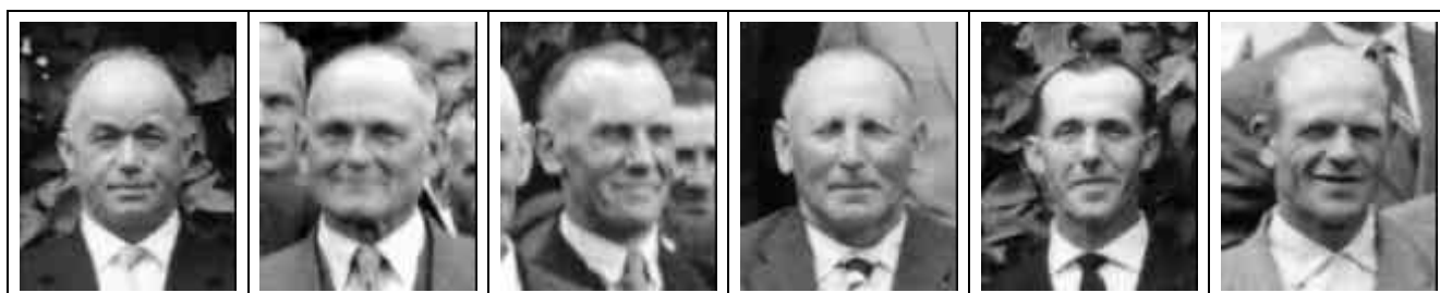
Abb. 6.3 Betriebsratsmitglieder der Westerwaldbrüche AG