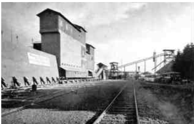
Abb. 2.16 Luckenbacher Lay

In einem Bericht der Westerwälder Zeitung vom 13.7.1933 wird das jahrelange Darniederliegen der Basaltindustrie infolge der Weltwirtschaftskrise beklagt. Die wenigen noch in Betrieb befindlichen Steinbrüche könnten nur eine geringe Arbeiterzahl beschäftigen; in einem der größeren Betriebe seien es z.B. früher fast 1000 Mann gewesen, „heute ein Häuflein von 50 - 60“. Anfang Juli 1933 fanden sich in Marienberg im Westerwälder Hof mehr als 50 Vertreter der gesamten Steinindustrie des Oberwesterwaldes mit den NSBO-Kreisbetriebszellenleitern und DAF zusammen, um über Wiedereingangssetzung, Absatz- und Lohnverhältnisse sowie alle sonstigen zur Klärung drängenden Fragen Richtlinien zu schaffen und Grundlegendes festzulegen. An dieser Zusammenkunft nahmen u.a. Besitzer und Direktoren der Basaltwerke Adrian, Linzer-Basalt, Dolerit-Basalt, Westdeutsche Hartsteinwerke, Stein-Union, Reeh, Westerburger Basaltindustrie