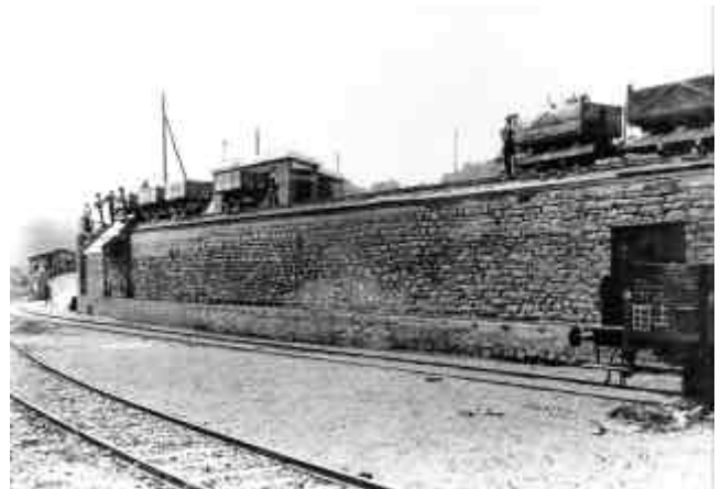
Abb. 2.7 Stöffel: Verladerampe