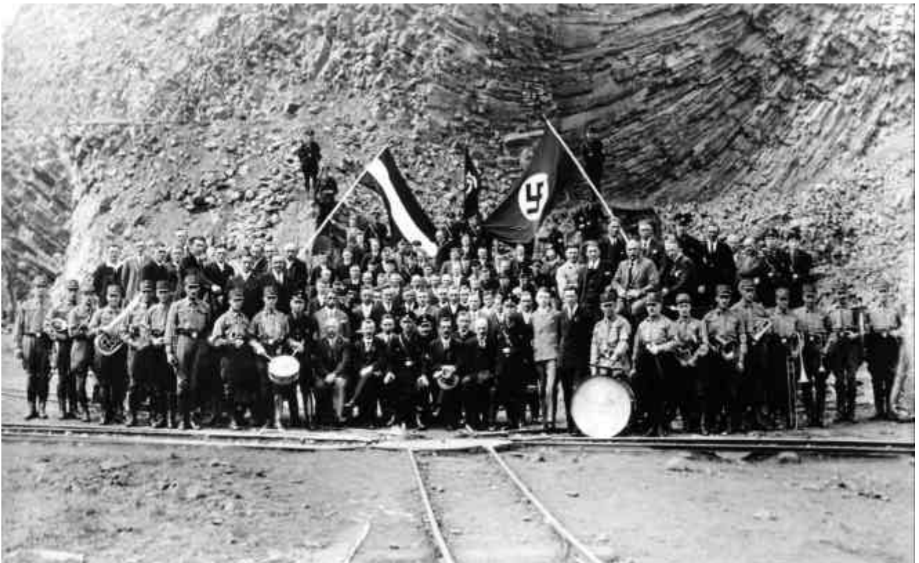
Abb. 5.1 Westerwaldbrüche Marienberg 1933; nach einem Giftmordanschlag auf einen SS-Sturmführer führten Polizei, SA und Kripo Frankfurt/M. den ganzen Tag Vernehmungen durch

Eine Woche später wurden die Befürworter einer nationalsozialistischen Einheitsgewerkschaft enttäuscht und stark zu-